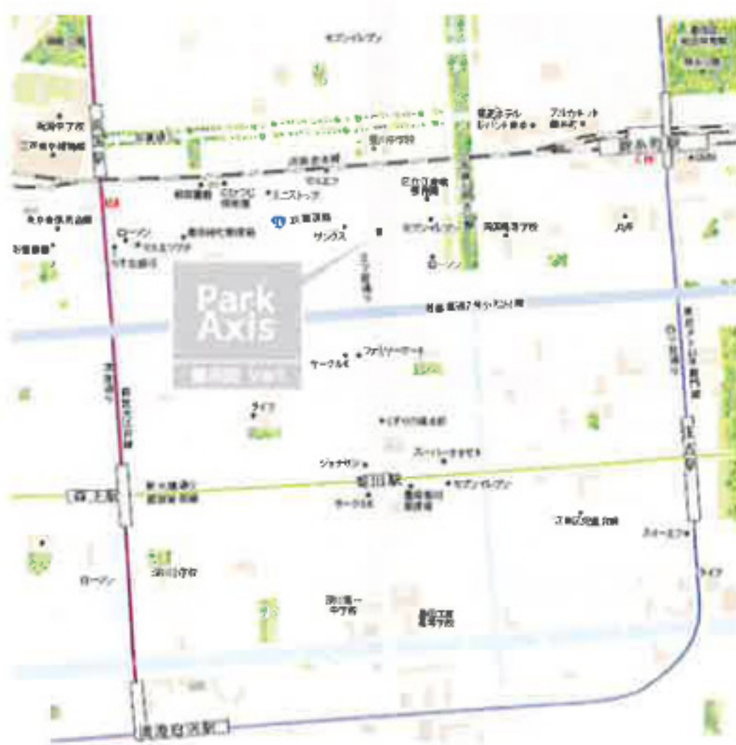
※間取図は裏面をご参照下さい。